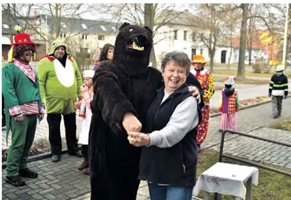
Podle historiků mají masopustní zvyky původ v předkřesťanských oslavách konce zimy.

Jde o třídní svátek, a stejně tak slavnostní období mezi Vánoce a postní dobou. Toto období začíná po svátku Tří králů (6. ledna) a končí na Popeleční středě. Konec je pohyblivý, je závislý na datu Velikonoc.