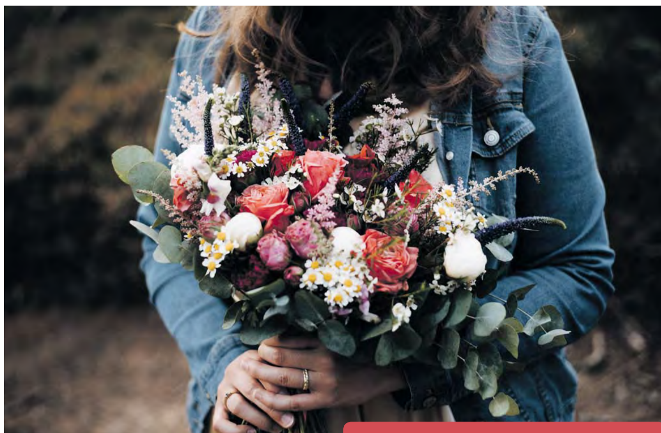
Oblíbené jsou kytice neuhlazené, „rozdivočelé.“

Běžné květinářství moc neřeší, odkud květiny jsou. Dováží se z Holandska, Polska, Itálie, z květinových burz, které je nakupují po celém světě. My spolupracujeme s malými pěstiteli, postupně se dostáváme k různým lidem, kteří mají statek, za ním pole, kde na malé ploše pěstují květiny. Ať už přímo na sušené nebo k řezu. V zimě je to samozřejmě náročnější. Pokud bychom chtěly vytvořit nějakou lokální kytku, tak by to byly spíše sušené květiny, které máme z léta nebo nějaké větve, šípky, bobule, jehličí, modřínové větvičky s malými šiškami.