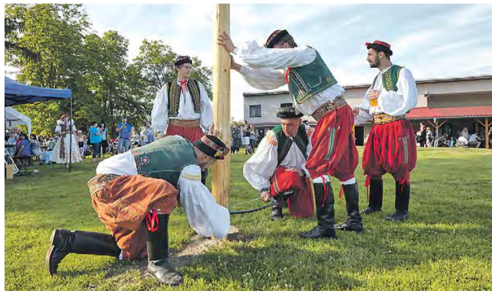
Kácení máje. Dřív májku bezměrovští dokonce hlídali.

Jízda králů v Bezměrově je součástí hodových oslav, které se konají sedm týdnů po Velikonocích. Odlišná je i tím, že se průvodu účastní