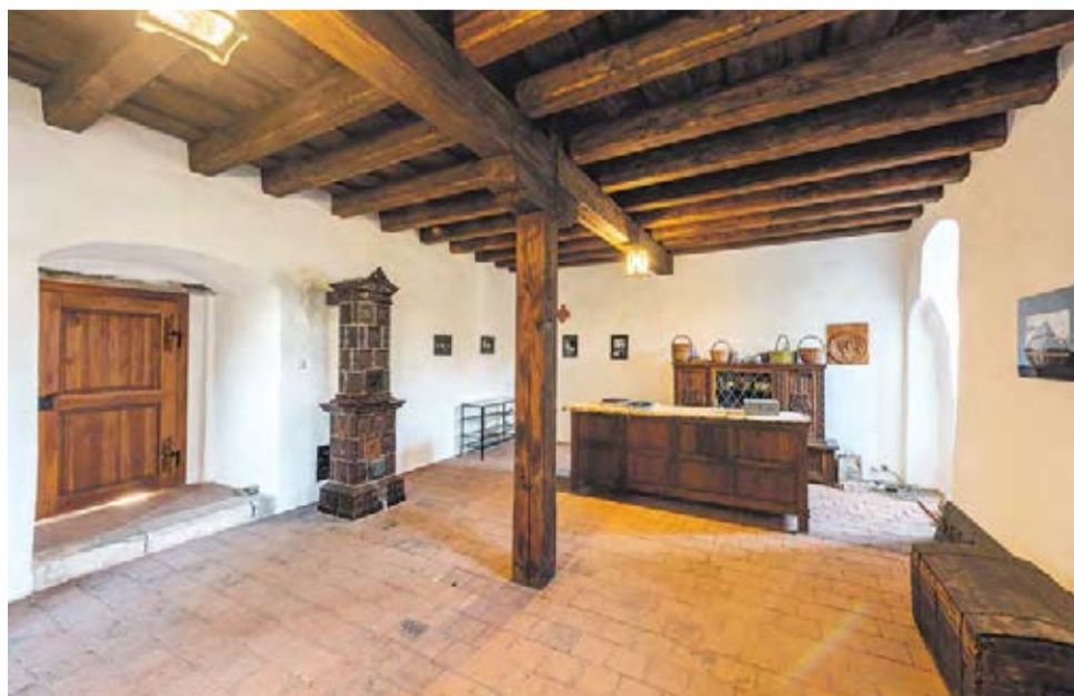
Zájemci mohou hrad navštívit, nemá ale zatím pevnou otevírací dobu. Nejsnadnější je dohodnout si návštěvu předem a nebo zamířit na některou z akcí.