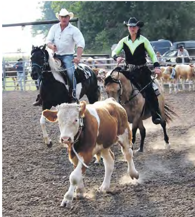
Westernové závody se v příštím roce budou konat po dvacáté.

své úspěchy nedává moc najevo, ale občas u nás výstavu holubů udělají. Šampiony naloží do klecí a jedou s nimi za moře nebo po Evropě. Soutěží se v různých kategoriích, třeba v rychlosti návratu zpět a jsou šikovni, daří se jim,