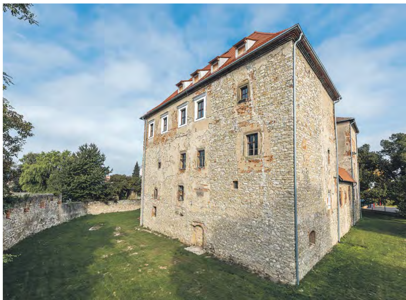
Historie hradu Kurovice se datuje ke konci 13. století. Z architektonického hlediska patří stavba mezi nejvýznamnější sídla nižší šlechty na Moravě.

Do roku 1988 hrad sloužil jako obecní bydlení, k dispozici měli místní pět bytů. „Podmínky tam byly velmi těžké. Někteří pamětníci tam