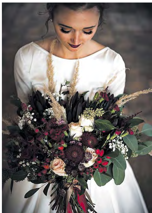
U svateb se květiny mnohdy stávají hlavní výzdobou celé slavnosti.