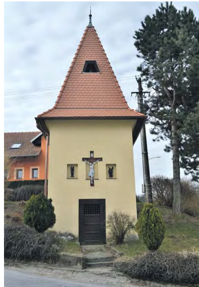
Malá, příkrčená na svahu, sleduje provoz na hlavní silnici vedoucí obcí již více než 200 let. Kaplička je zasvěcena sv. Floriánovi a sv. Janu Nepomuckému.

Mezi zajímavostmi Lubné patří více než dvě stě let stará kaplička se zvoníci zasvěcená sv. Floriánovi a sv. Janu Nepomuckému. Okolí ale Lubnou pravděpodobně zná především kvůli závlahové retenční nádrži. Je kousek za obcí, u lesa. Místní vodní stavbě říkají zkráceně přehrada. V zimě se tam chodí bruslit, v létě koupat, na březích sedávají rybáři. „Původně to byla závlahová nádrž pro zemědělské družstvo, ale svému původnímu účelu už přestala sloužit a v tuto chvíli funguje jako místo odpočinku a rekreace. Když mrzne, konají se tam i hokejová utkání mezi