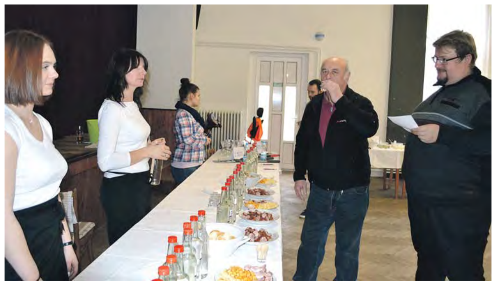
V Lubné na Kroměřížsku letos uspořádali první ročník koštu pálenek a pomazánek.