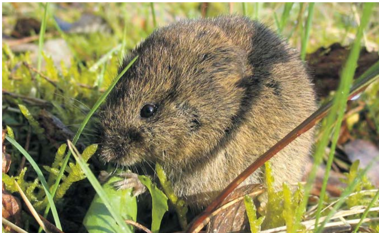
Kalamitní situace podle Zemědělského svazu České republiky pokračuje. Hraboši trápí i zemědělce v Olomouckém kraji.

Kalamitní situace podle Zemědělského svazu České republiky pokračuje. Mezi zasažená místa patří i Olomoucký kraj. „Není to ale už jen věc střední a jižní Moravy, ale i Čech. Zatím máme podrobně zmapované škody ve výši 1, 7 miliardy korun, ale odhadujeme, že to bude určitě