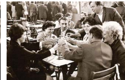
Na zdraví přítuková mladík Grbavčíc