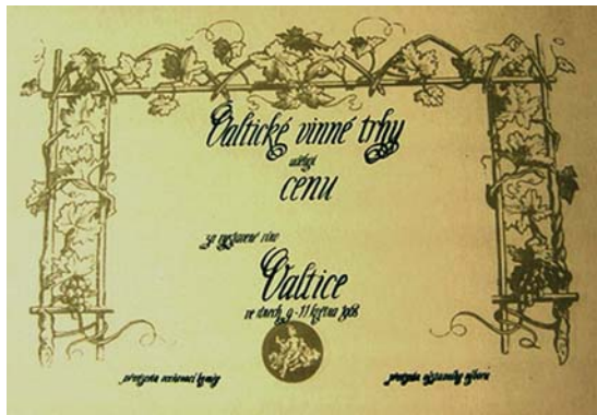
První verze diplomů udělovaných na VVT v letech 1967-1970