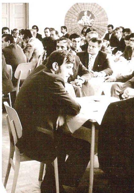
Novostavba zaplněná vinaři