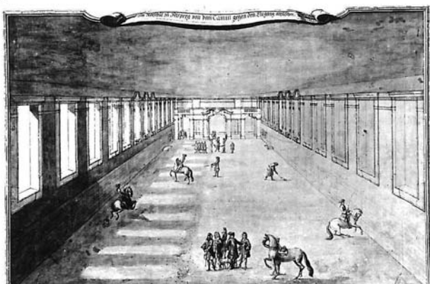
Obrovský prostor zámecké Jízdárny (76 m dlouhá, 17 m široká) byl využíván především pro knížecí koně a jezdeckou školu