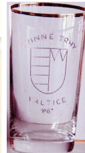
Chutnačka s ročníkem 1967

Bločky na víno byly jenom v jedné ceně, očíslované a vytisknuté pro několik ročníků VVT