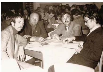
Zaplňený sál Novostavby – více než 150 vinařů pozorně sledovalo přednášky

leté přestávce opět organizovat před zahájením VVT „Oborový den“ za účasti předních odborníků z ČSSR. Tím se protáhl program výstavních dnů na čtyři, neboť zahájení a předání medailí se uskutečnilo odpoledne po Oborovém dnu.