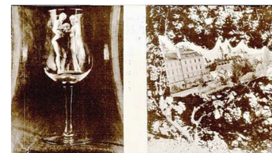
POZVÁNKA NA I. VINNÉ TRHY VE VALTICÍCH 7.A & 8.V. 1967