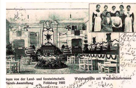
Iruss von der Land- und forstwirtschaftl. 'ertels-Ausstellung Feldsberg 1902 Weinkosthülle mit Weinverkäuferinnen

va k 50. výročí založení Okresního hospodářského spolku. Součástí této výstavy bylo také poprvé lesnictví a myslivost, a tak se vystavovalo na mnoha místech Valtic: v Lednické aleji, na náměstí, na Sobotní ulici a také v zámecké jízdárně. Že to byla událost skutečně pozoruhodná, o tom svědčí mimo jiné vydání knihy „Dějiny města Valtic“, a také dobové pohlednice, kterou se podařilo získat městu Valtice od pana Mgr. Weinlanda z Vídně. Je na ní vidět vyzdobená zámecká jízdárna před výstavou vín a obsluhující personál.