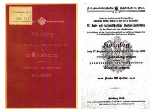
Organizátoři výstavy vydali také výpravny Katalog s popisem mnohých exponátů

va k 50. výročí založení Okresního hospodářského spolku. Součástí této výstavy bylo také poprvé lesnictví a myslivost, a tak se vystavovalo na mnoha místech Valtic: v Lednické aleji, na náměstí, na Sobotní ulici a také v zámecké jízdárně. Že to byla událost skutečně pozoruhodná, o tom svědčí mimo jiné vydání knihy „Dějiny města Valtic“, a také dobové pohlednice, kterou se podařilo získat městu Valtice od pana Mgr. Weinlanda z Vídně. Je na ní vidět vyzdobená zámecká jízdárna před výstavou vín a obsluhující personál.