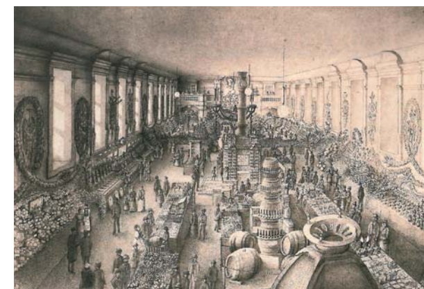
Dobová rytina výstavy ovoce a vína v Zimní Jízdárně v polovině 19. století

Ve dnech 20. až 24. září roku 1902 se konala ve Valticích výsta-