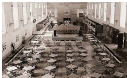
Pohled z balkonu na Jízdárnu, připravenou na výstavní dny VVT – stolové uspořádání