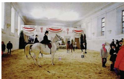
Jízdárna za Liechtensteinů - historický snímek z doby konání jezdecké školy koncem 19. století

dobí od 30. září do 5. října v roce 1858 uspořádal Okresní hospodářský spolek ve Valticích pod patronací knížete Jana II. z Liechtensteina zemědělskou výstavu – poprvé v zámecké jízdárně. I když byla jízdárna dostavěna již v roce 1715, touto výstavou byla poprvé zpřístupněna veřejnosti. Návštěvníci mohli obdivovat nové zemědělské stroje, výrobky z hedvábí, potřeby pro domácnost a také 169 vzorků ovoce a zeleniny od místních pěstitelů. K ochutnání bylo neuvěřitelné množství 2 000 vzorků vín z Valtic a okolních vinařských obcí, což svědčí o velké popularitě pěstování révy vinné v tomto regionu.