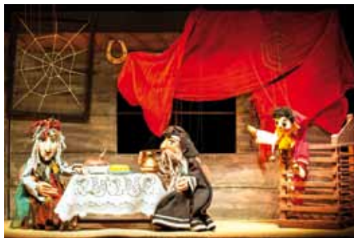
Kašpárkův první krok do života.

da, za kterou můžeme našim předkům jen děkovat," upozorňuje divadelník, který pracuje jako fyzik na Univerzitě Palackého v Olomouci. Ačkoli jsou ochotníky, podmínky mají profesionální.