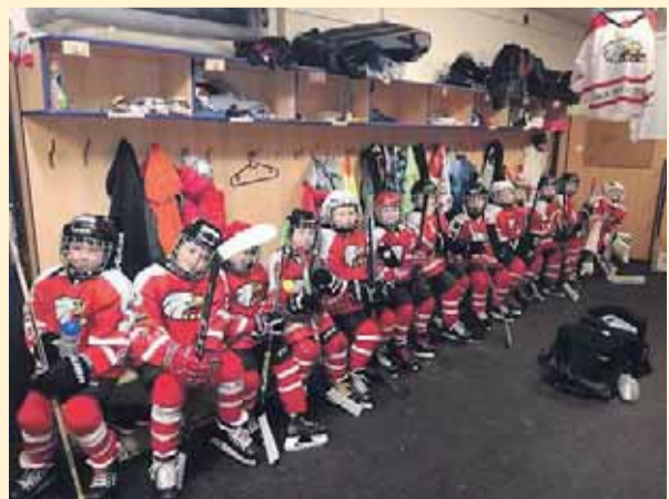
Hokejisté SK Prostějov 1913 z ročníku 2012 na mezinárodním turnaji v Orlové, který vyhráli.

Na cestě za prvním místem si kluci z Hané poradili s vrstevníky ze Šumperka, Uherského Brodu a domácí Orlové, ovšem rovněž se soupeři ze Slovenska, Maďarska, Rakouska a Běloruska. Prostějovskému hokeji, který loni oslavil 105. výročí, tak rostou nové naděje. (kom)