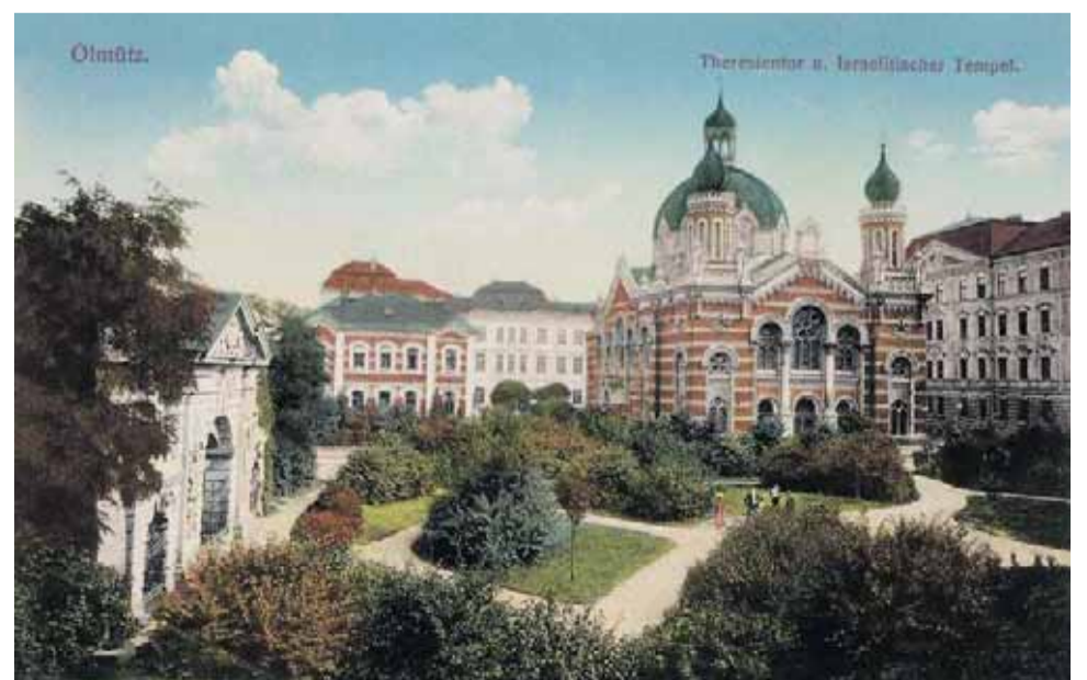
Olomoucká synagoga stávala na dnešním Palachově náměstí od roku 1897 do roku 1939, kdy byla vypálena olomouckými fašisty.

Těsně po německé okupaci ji olomoučtí nacisti zapálili. Dnes slouží volně prostranství jako parkoviště. (jej)