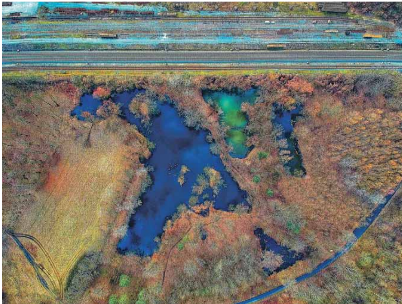
Na snímku Černo- vírský les u Olomouce z ptačí perspektivy.

Prvním snímkem pořize- ným z výšky, který Patrik