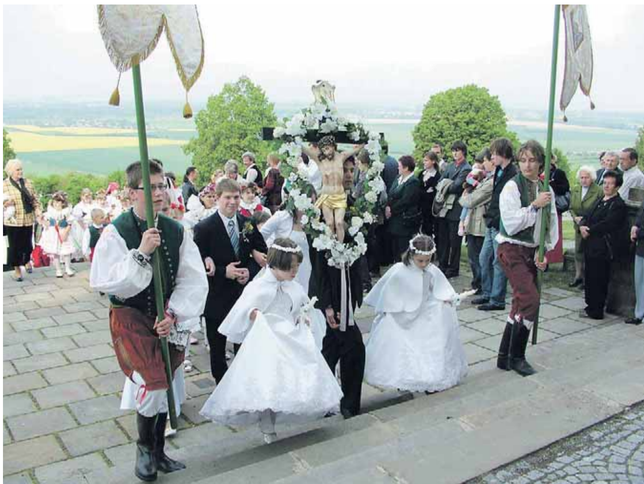
V Samotiškách se každoročně koná prosebný průvod, směřuje k bazilice na Svatý Kopeček.

Hodové slavnosti se konají celý víkend, opět vždy po svátku sv. Floriána, přičemž hlavním dnem je neděle. Letos připadají hody na 12. května. „Kolem sedmé hodiny ráno se schází v místní kaple dechovka Dolanka a taky loňský mládenec s družičkou. Společně s hudbou poté vyzvednou svého nástupce a novou družičku v jejich bydlišti, kde je již pro ně nachystané drobné pochoštění. Následně se vydají všichni zpět ke kapličce. Tam vyzvedne loňský mládenec nazdobený kříž a předá ho novému mláďenci, což je to nejdůležitější. Jde o hlavní symbol. Před kaplí sv. Anny a sv. Floriana se již scházejí spoluobčané, krojovaní i nekrojovaní a do klopy dostávají od děvčat kytičku,“