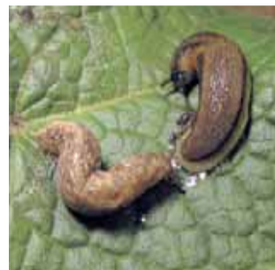
Slimáček polní a sítkovaný

Na zahrádkách je nejjednodušší odchyt slimáků v místě výskytu pod položená prkna, desky, vlhké pytle, hadry, dlaždice, převrácené kořenáče či na návnadu s pivem.