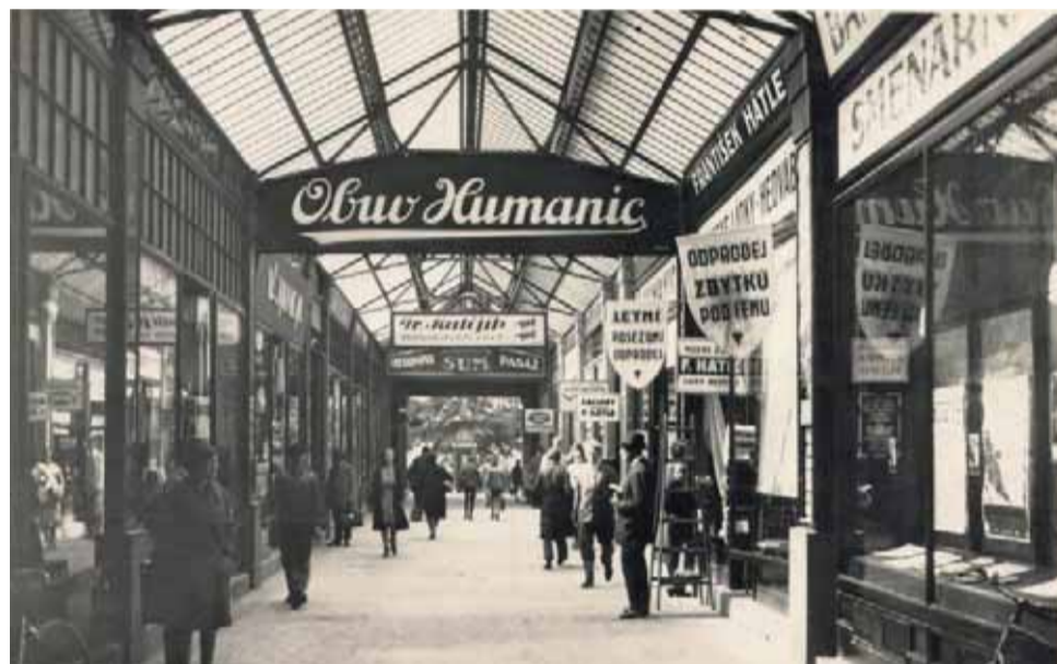
V pasáži působila celá řada živností, což ilustruje fotografie z roku 1931.