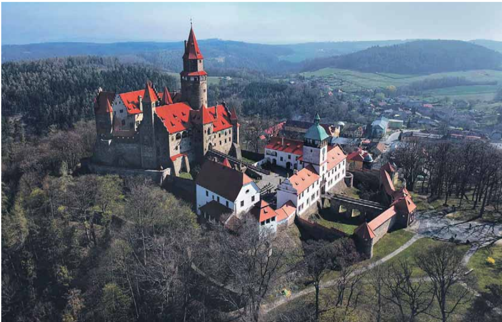
Pohádkový hrad. Bouzov patří každoročně k nejnavštěvovanějším památkám Olomouckého kraje. Jen v roce 2017 sem zamířilo přes 111 tisíc turistů. Díky tomu neměli na rozdíl od jiných míst problém se sháněním průvodců.