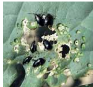
Dřepčik na zelí