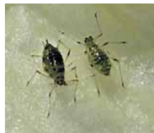
Mšice na salátu

Sledujte také poškozování způsobované slimáky (slimáčkovití, slimákovití, plzákovití), zejména na zelenině, jahodách a okrasných rostlinách. Poškozují klíčící rostliny, ožirají stonky, lodyhy, plody, hlízy i dužnaté kořeny. V blízkosti požerků bývá zpravidla perletově lesklý sliz. Nezaměňujte tyto škody s požerky housenek mūr; zejména na zelenině. Chemická ochrana spočívá v kladení nástrah granulovaných návnadových přípravků - Clarite NEO, Metaldehyd NOVI, Meterex Inov, Slimex nebo i Ferramol, Sluxx HP, aj.