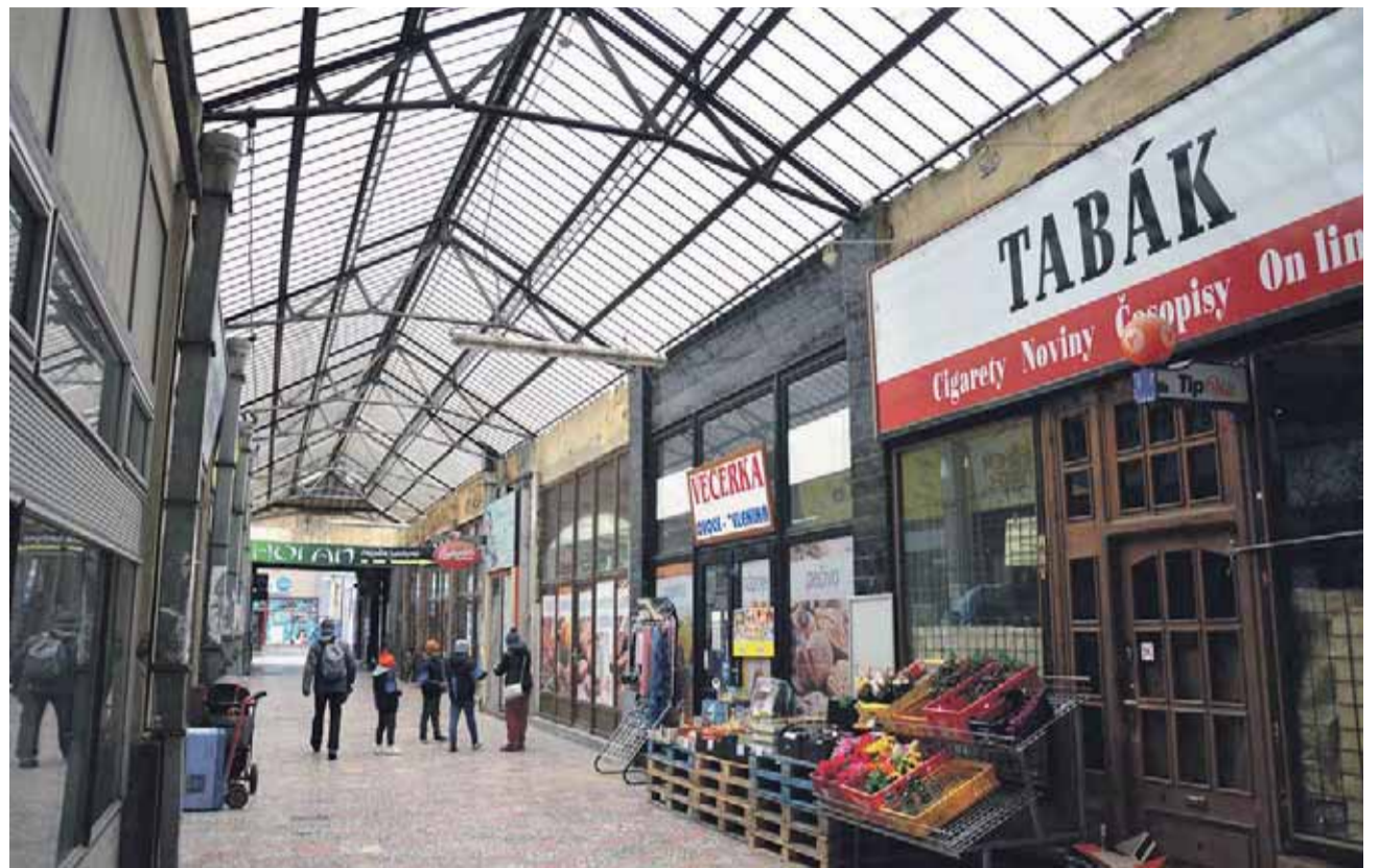
Současný stav. Roky zanedbávaná pasáž by si zasloužila důkladnou opravu.

V současné době už je zde v provozu jen večerka, asijské bistro a vietnamský obchod. Přitom ještě nedávno tu lidé mohli zajít do prodejny kol, nábytku nebo módního butiku. Odliv obchodníků je spojen s konkurencí nákupních