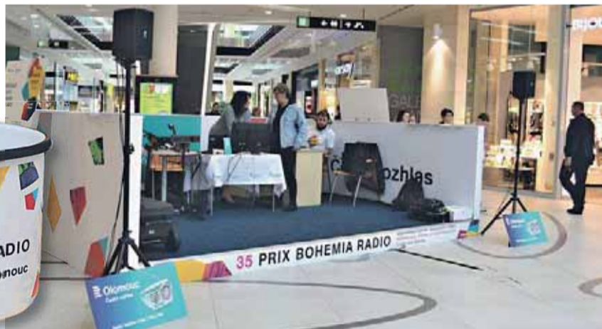
Třetí ze zastávek na trase festivalové hry se nacházela v obchodní galerii Šantovka. Z jejího přízemí vysílalo od konce března až do závěrečného dne festivalu Prix Bohemia Radio speciální studio Českého rozhlasu Olomouc.

K cíli festivalové hry se už muselo znovu do Atria.