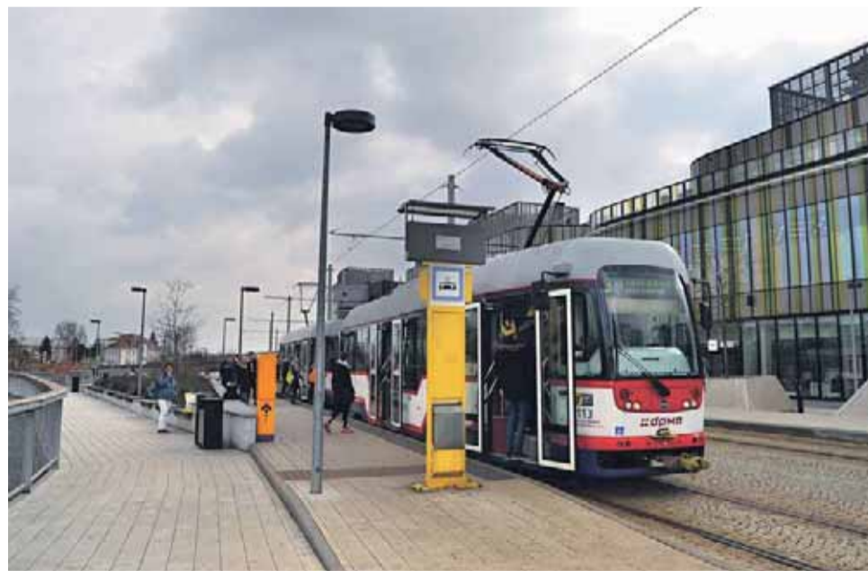
Tramvajová zastávka Šantovka u stejnojmenné obchodní galerie patří v Olomouci k těm mladším. Zdejší koleje jsou tak v mnohem lepším stavu než například ty v ulici 8. května, které už nutně potřebují opravu. Na snímku zastávka u Šantovky ve směru na Tržnici a Envelopu.

V každé tramvaji a autobusu bude zpočátku jeden validátor, a to buď vepředu u řidiče, uprostřed nebo vzadu. Cestující při nástupu přiloží na dis-