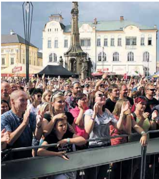
V Litovli ani letos nebude chybět jarmark, atrakce a zábavní soutěže pro děti, dobrodružná příjízka na pramicích pod náměstím nebo ohňostroj.

Ani tím výčet aktivit festivalu nekončí: od 11 do 19 hodin bude možné vystoupat do radniční věže. Kdo předloží vstupenku na Hanácké Benátky, může si v základní škole Vítězná zajít na hodinu zdarma do posilovny a bazénu. Totéž platí i pro litovelské Městské koupaliště (přírodní biotop) od 9 do 19 hodin. (jej)