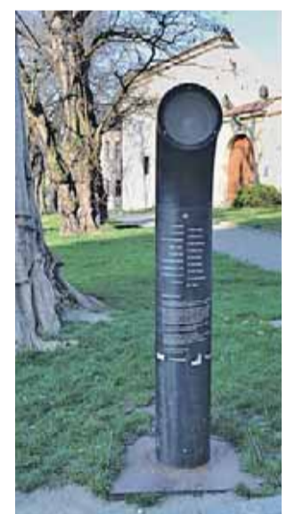
Olomoucký poeziomat na Václavském náměstí u katedrály sv. Václava. Po stis- nutí tlačítka přehraje například báseň Svatý Kopeček, kterou napsal rodák z Prostějova Jiří Wolkler.

S mobilem v ruce se v Přerově nikdo neztratí. Zvláště, když používá průvodce pro chytré telefony. Aplikace se zamě- řuje na místní památky, tipy na výlety, pravidelné kulturní